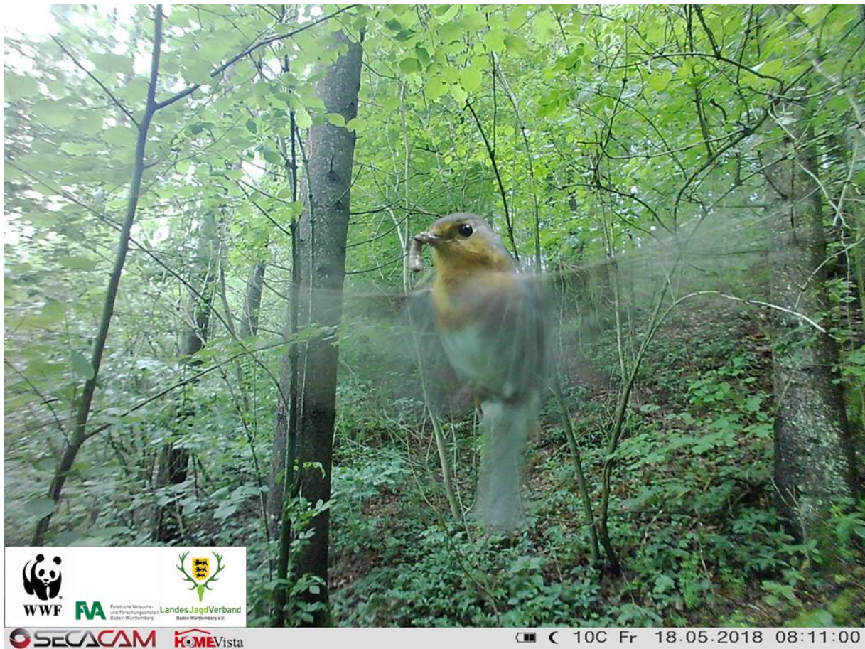
Rotkehlchen vor Wildtierkamera